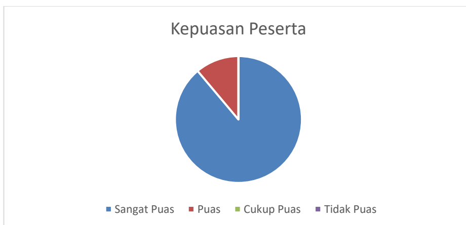
Gambar 3. Kepuasan peserta terhadap materi yang diberikan

Hasil pelatihan pembelajaran berdiferensiasi menunjukkan bahwa peserta memiliki kepuasan terhadap materi yang diberikan oleh pelaksana. Berdasarkan hasil wawancara dengan kepala sekolah bahwa selama ini belum mengetahui bagaimana pelaksanaa yang sesuai dengan kurikulum Merdeka dalam pembelajaran berdiferensiasi, dan setelah mengikuti pelatihan mendapatkan gambaran apa yang harus diterapkan pada proses pembelajaran.