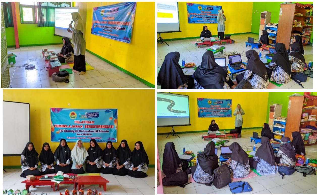
Gambar 1. Dokumentasi pelatihan pembelajaran berdiferensiasi

pada pembelajaran berdiferensiasi. Asesmen digunakan sebagai bagian dari peningkatan mutu pendidikan (Muflikhah et al., 2021).